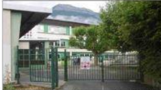
Dans le projet de rénovation du groupe scolaire, l'objectif est de créer des parvis sécurisés et éloignés de la rue des Aiguinards.

Réfléchissant sur la localisation et les usages des parvis, c'est un accueil sécurisé qui a été privilégié. Espaces visibles et lisibles, les participants ont souhaité que dans ses aménagements, les parvis s'imposent comme des lieux de transitions entre l'extérieur et l'école. Véritable lieu de rencontre et proches des habitations, ces derniers ne devront pas encourager des regroupements