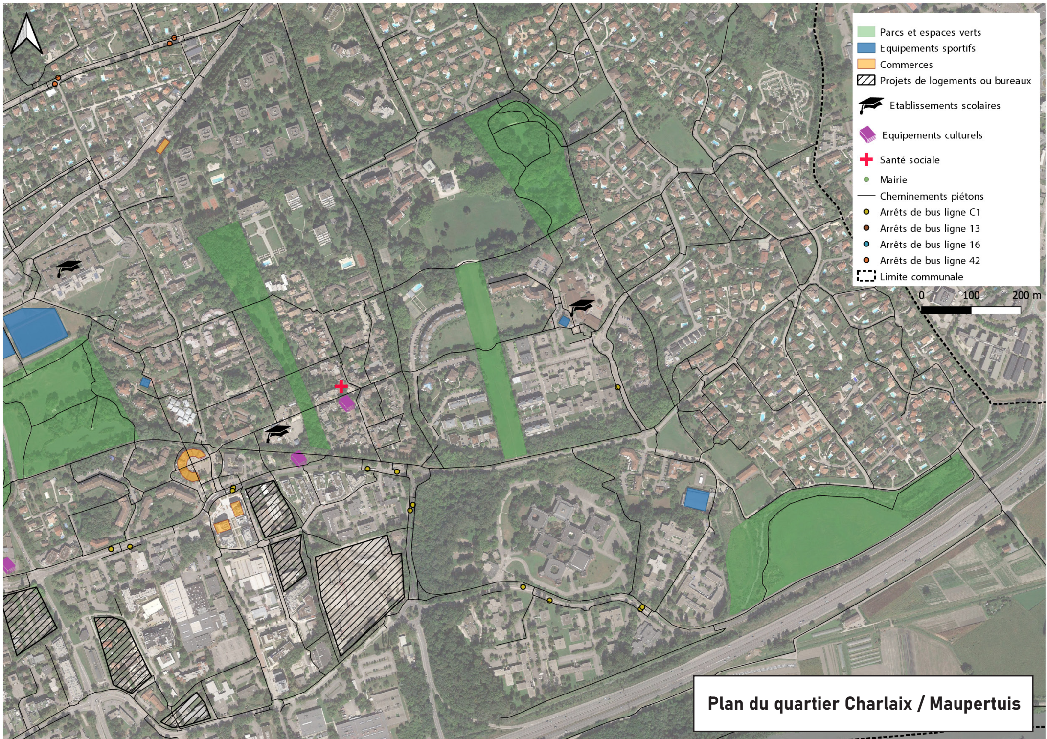
Plan du quartier Charlaix / Maupertuis